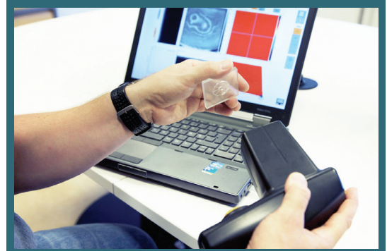
Få med deg spennende foredrag.