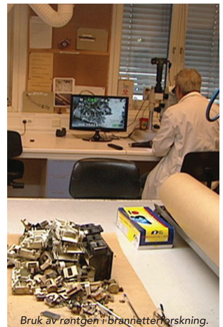
Bruk av røntgen i brannetterforskning.

Konferansen henvender seg til alle som arbeider innen fagområdet NDT og kvalitetssikring, produktkontroll, skoleverk, konsulentvirksomhet, forskning, og som ønsker å holde seg informert om den siste utvikling på området